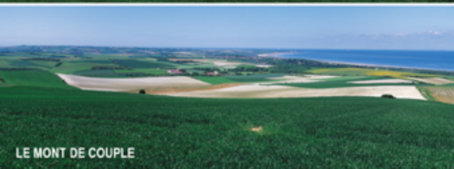
LE MONT DE COUPLE

Office de Tourisme de La Terre des 2 Caps Place de la Mairie - 62179 WISSANT Tél. : 0.820.207.600 - Fax : 03.21.85.39.64 www.terredes2caps.com / tourisme@terredes2caps.com